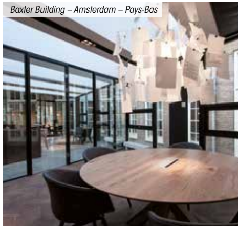
Baxter Building – Amsterdam – Pays-Bas

*** Pour les non résidents seuls les immeubles détenus en France sont pris en compte.